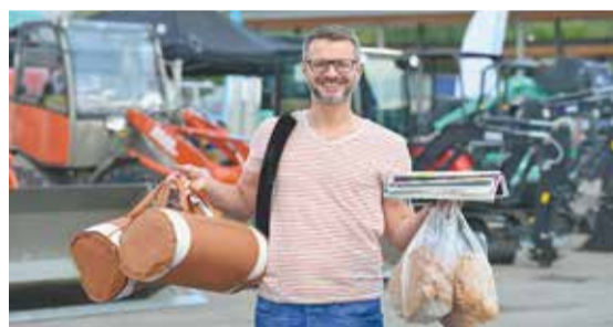
Einkaufsparadies und Erlebniswelt Südwest Messe: Neun Tage lang Neues entdecken und Spaß haben.

Fleck: Auf 60.000 Quadratmetern in 21 Messehallen und im Freigelände für schwere Maschinen sowie im Afrikanischen